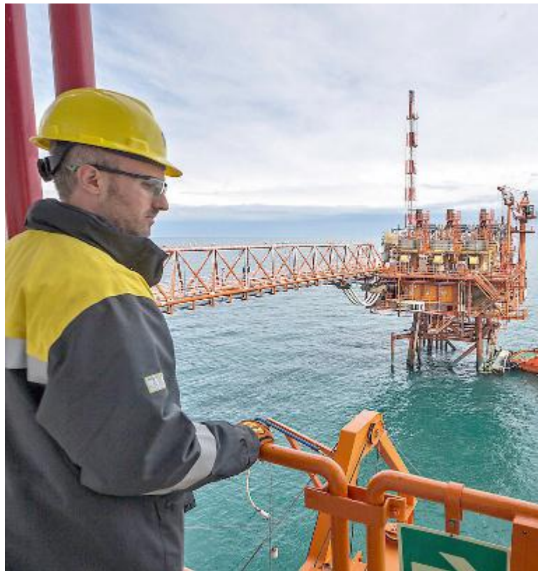
La piattaforma Garibaldi, al largo dell'Adriatico